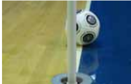
But non marqué