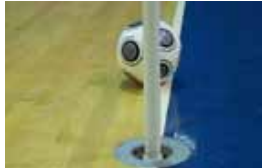
But non marqué