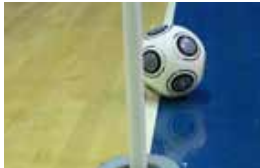
But non marqué